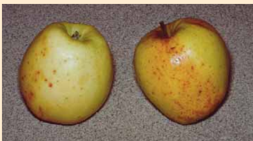
Die Streuobstsorte des Jahres 2010 ist die Apfelsorte „Kleiner Fleiner“